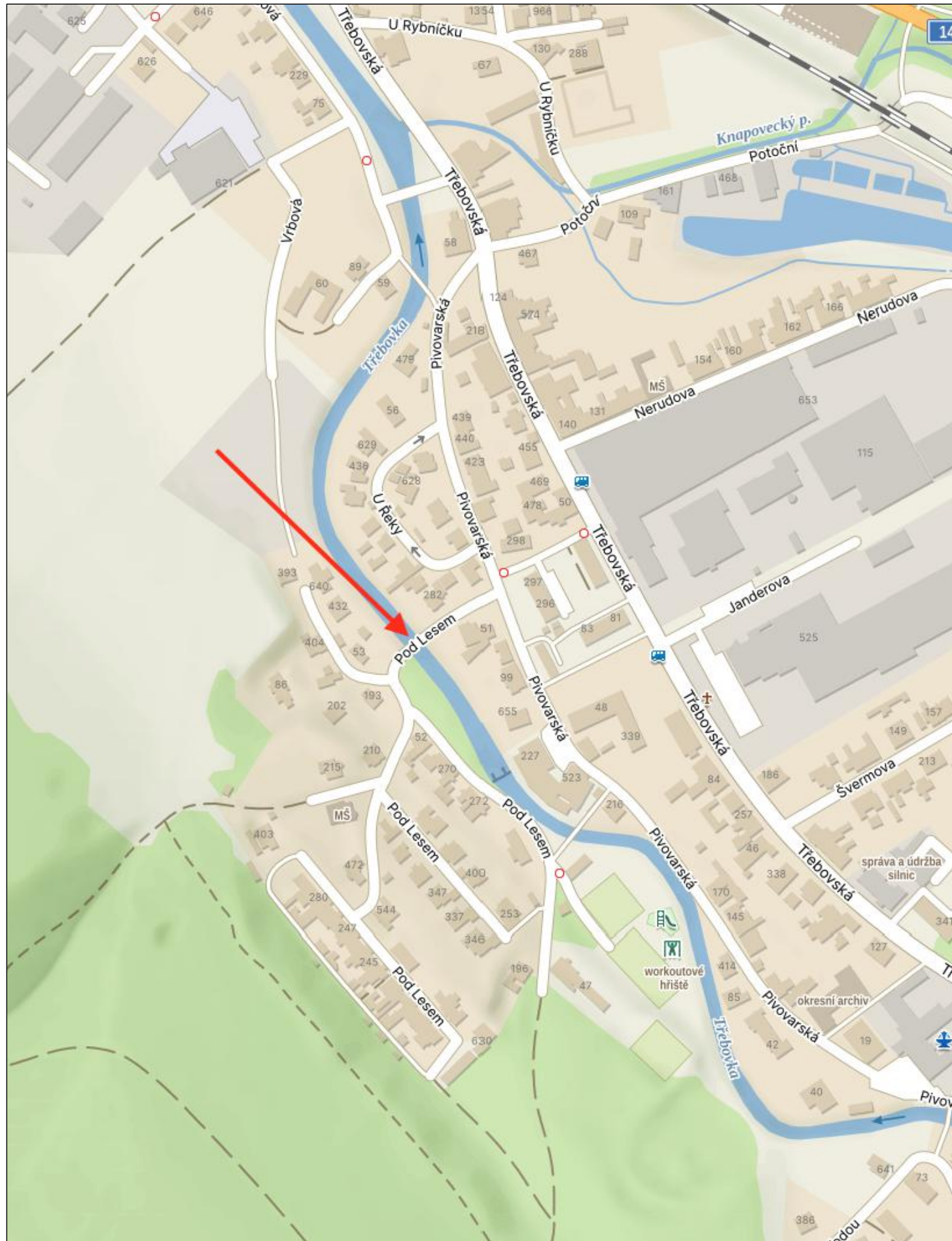
SITUAČNÍ VÝŘEZ 2