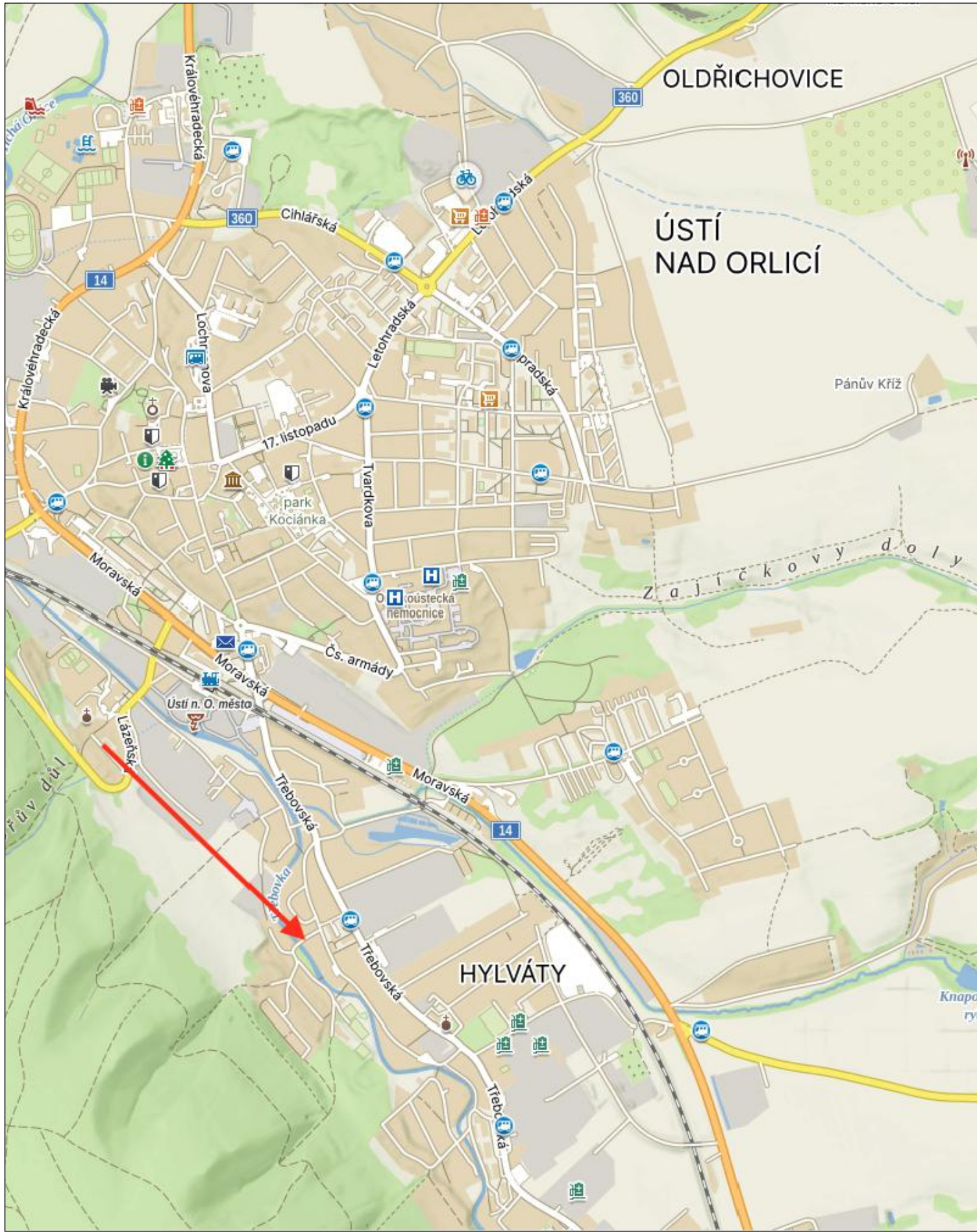
SITUAČNÍ VÝŘEZ 1